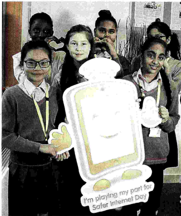
RAGAZZI DI TUTTO IL MONDO L'edizione 2016 di "Safer Internet day"