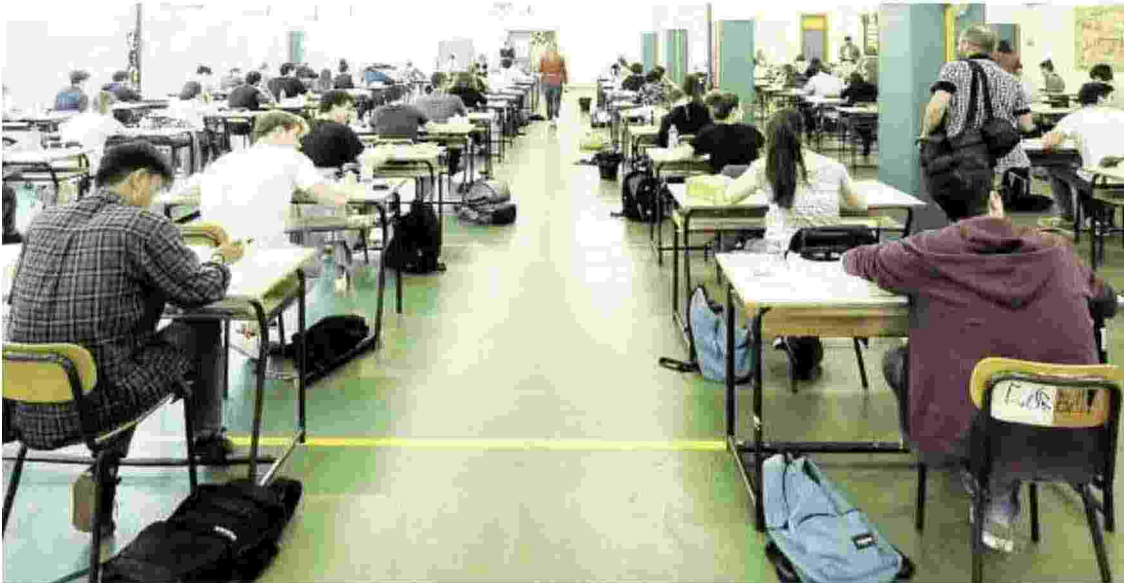
Studenti impegnati in una prova scritta dell'esame di maturità