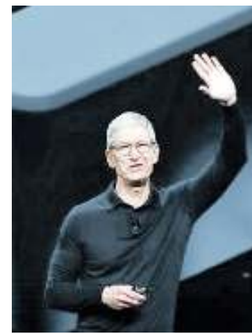
NUMERO 1 Tim Cook, ceo di Apple

Gli iPhone avranno anche un nuovo sistema operativo: iOS 12,