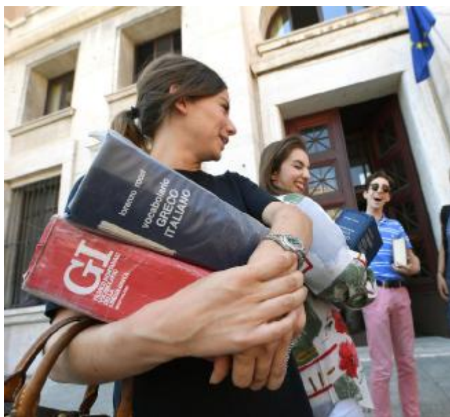
La seconda prova scritta sarà Greco per il liceo classico

Anche quest'anno ci sarà #NoPanic, l'iniziativa social del Miur, lanciata lo scorso anno, per accompagnare con materiali informativi, consigli di esperti e video esplicativi i mesi che precedono la Maturità per la quale sono state fissate già da tempo le date clou: prima prova mercoledì 20 giugno, seconda prova il giorno successivo, terza prova il 25 giugno. Gli orali cominceranno in linea di massima una settimana dopo per dare il tempo alle commissioni di correggere gli elaborati scritti. Ai candidati la mini-