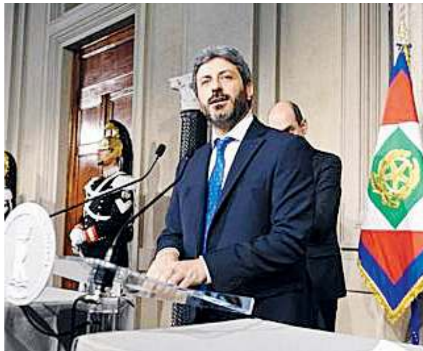
Fico: "Nei prossimi giorni ci sarà anche un dialogo all'interno del M5S e del Pd"

Maurizio Martina , ha parlato di passi avanti, ribadendo che ogni decisione verrà presa in direzione. «Riconosciamo e registriamo passi in avanti importanti, che vogliamo riconoscere, in particolare rispetto ad alcune richieste fondamentali che avevamo avanzato già al primo giro di consultazioni, chiudere la fase di confronto che il M5S aveva con il centrodestra e sul quale sono arrivate parole definitive, molto importanti, che vogliamo riconoscere come fatto politico. Non nascondiamo le difficoltà e le differenze che animano questo confronto tra noi, è giusto dirlo per serietà verso il Paese - ha puntualizzato il reggente Pd - Siamo forze diverse, che hanno espresso ed esprimono anche punti di vista molto differenti ma questo non esclude la possibilità di riconoscere i passi in avanti. "Abbiamo deciso di convocare».