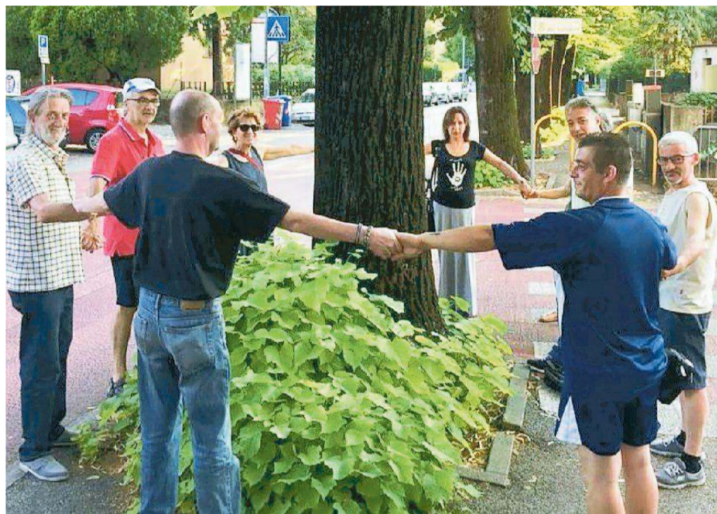
Un girotondo degli attivisti intorno ai tigli di via Cappuccini, poi abbattuti nel corso dei lavori dei giorni scorsi

- Il ministero dell'Istruzione ha deciso la riforma con due scritti, orale e commissari interni». Sarà, dunque, il momento della fine di un'epoca e dell'avvio di una maturità più snella nel 2019? Mai dire mai, nel settore istruzione, mentre le statistiche di www.skuela.net continuano a denunciare le "spiate" sul quizzone. «Tre studenti su cinque - è il risultato di un monitoraggio a campione - hanno informazioni sul test». Occhi aperti su chi sgarrisce e anche a Pordenone i commissari terranno gli occhi aperti. (c.b.)