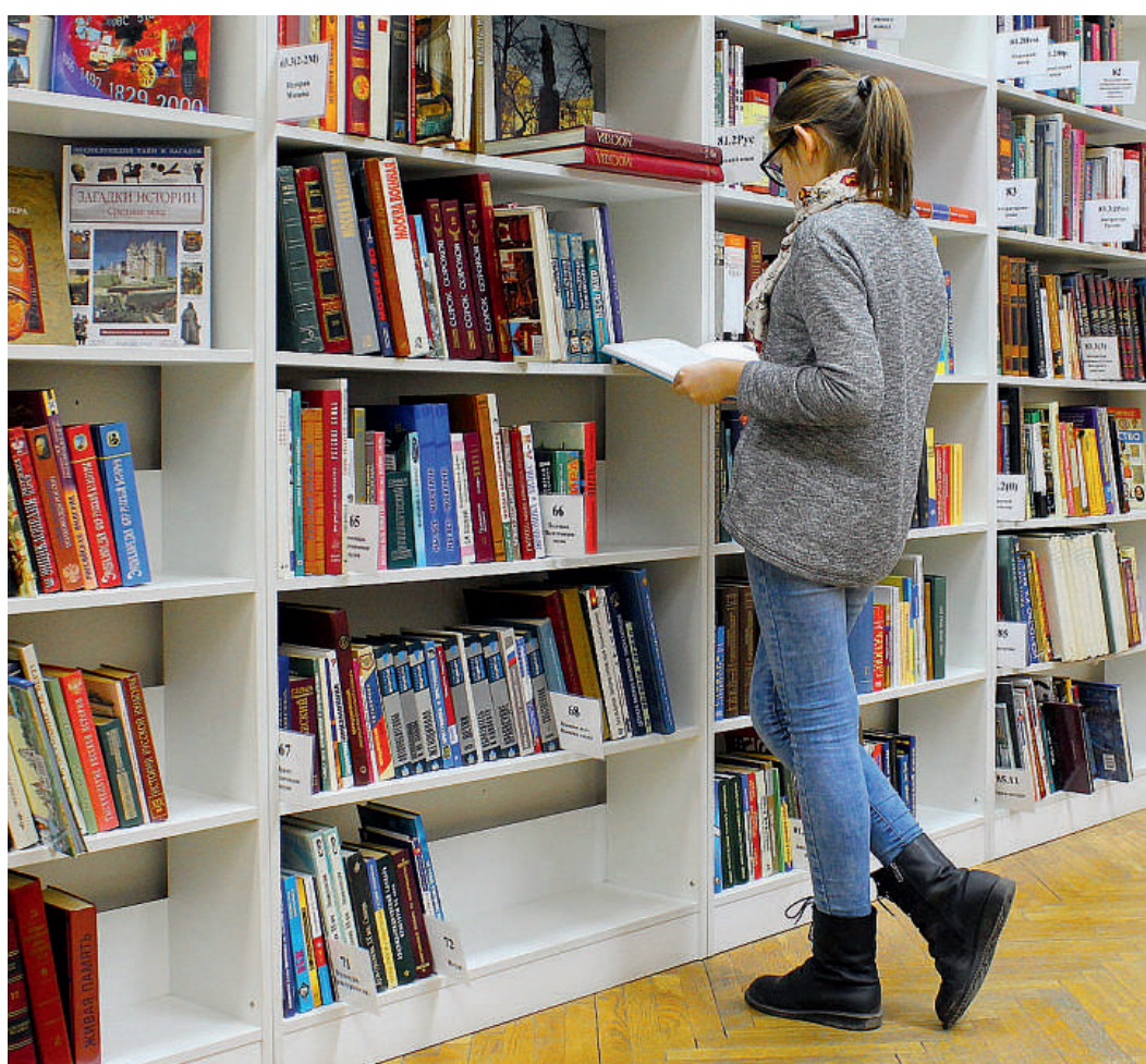
I libri cartacei rimangono comunque preferiti rispetto a quelli digitali

Tra quelli che non compreranno testi usati, il 47% lo farà perché non ama avere libri con annotazioni di altri. A cui si aggiunge un 20% che è preoccupato dal fatto di non avere contenuti aggiornati, visto che le edizioni cambiano di frequente. Un 6% non vuole perdere tempo a cercare l'usato in buone condizioni. Solo il 5% ha pre-