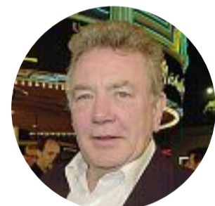
L'attore Albert Finney

● È stato il detective Hercule Poirot in «Assassino sull'Orient-Express» e lo zio Henry in «Un'ottima annata»; il padre inventore di storie in «Big Fish» e l'avvocato di Julia Roberts in «Erin Brockovich». Ma non bastano quattro ruoli per riassumere la carriera di Albert Finney, scomparso a 82 anni dopo una breve malattia. L'attore britannico aveva inanellato 5 nomination all'Oscar (senza mai conquistarne uno), ma era stato capace di vincere tre Golden Globe, il primo nel 1964 per «Tom Jones». Sigilli di una carriera avviata nel 1960 e nata con il teatro di Shakespeare, Finney ha lavorato anche con Audrey Hepburn in «Due per la strada» e in «Skyfall», capitolo della saga di 007. Fra gli amori della sua vita, Anouk Aimée, che recitò per Fellini.