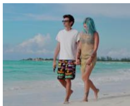
Fabio Rovazzi e Karen Kokeshi ai Caraibi

■ Fabio Rovazzi ha una nuova fidanzata: la YouTuber 25enne Karen Kokeshi. «Con Karen ci conosciamo da tempo, non c'è mai stato nulla perché entrambi eravamo fidanzati. Quando ci siamo ritrovati single è scattato subito qualcosa di bello. Oggi ci godiamo il nostro primo viaggio insieme». Fabio Karen stanno infatti trascorrendo una vacanza ai Caraibi.