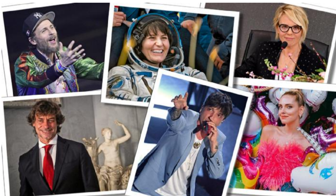
Da sinistra, in alto, Jovanotti, Cristoforetti, De Filippi e, sotto, Angela, Ultimo e Ferragni: i maturandi 2019 vorrebbero essere interrogati da loro

Skuola.it ha chiesto agli studenti chi vorrebbero all'esame