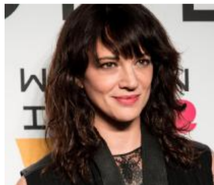
Asia Argento, ex compagna di Morgan

■ Morgan, che il 5 giugno dovrà lasciare la sua casa venduta a un'asta giudiziaria, chiede aiuto alla ex ad Asia Argento, «con cui siamo in buoni rapporti», dice il cantante, «e che è stata la causa principale, con un pignoramento, di tutto il procedimento giudiziario». Ma l'attrice risponde piccata: «Marco non ha perso casa per colpa mia e non capisco in che modo dovrei aiutarlo».